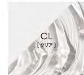
染色効果のないアイテム。

・実際の染め上がりの色は、地毛の色により多少異なります。また、印刷物ですので、実際の色とは多少異なります。・このカラーガイドは5分放置で染めたときの標準色です。 ・ブリーチのダメージによるカラーの吸い込みも考慮している為、特に寒色系は18レベルの方が濃い仕上がりがイメージになっています。